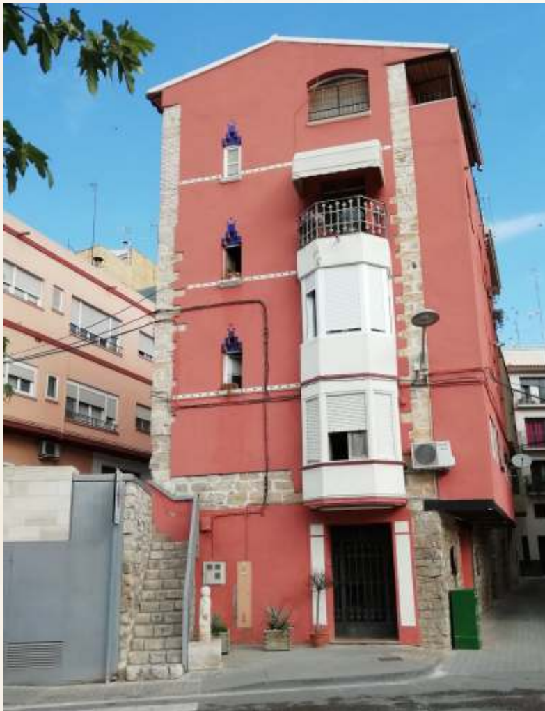
(Fraga, 2019. Actual edifici Plaça Espanya, 18)